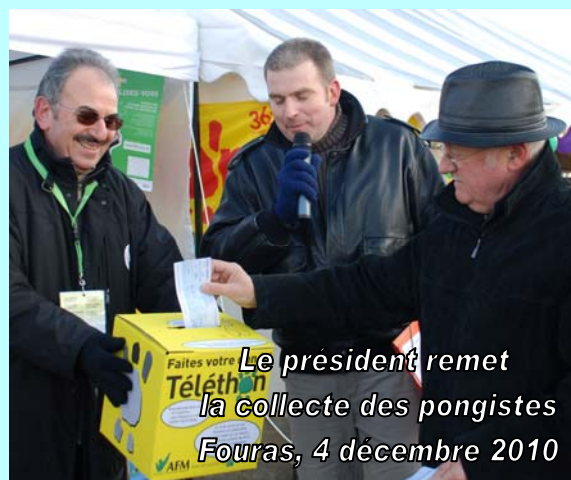
Le président remet la collecte des pongistes Fouras, 4 décembre 2010

Le club a participé au Téléthon 2010 dont la ville de Fouras était ambassadrice, en organisant le mercredi 1 er décembre des animations dont les bénéfices (200€) ont été remis par le président à l'association française contre la myopathie, sur la place Carnot le samedi 4 décembre 2010.