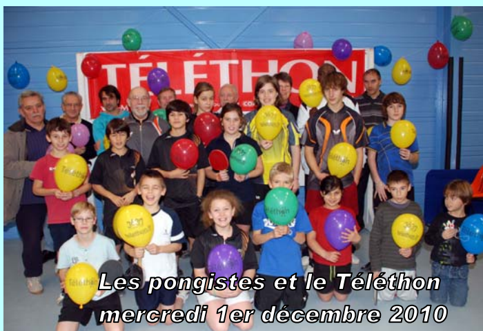
Les pongistes et le Téléthon mercredi 1er décembre 2010