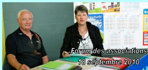
Forum des associations 18 septembre 2010

Afin d'informer tous ceux qui veulent découvrir notre activité, le club pongiste de Fouras a tenu un stand le samedi 18 septembre de 15h à 18h à l'occasion du Forum des Associations fourasines. Les personnes intéressées ont été invitées à regarder l'équipe féminine de Pré Nationale ainsi que la Régionale 3 masculine qui jouaient leur premier match de la saison. Peu de monde à cette journée de promotion qui nous a amené 5 nouveaux licenciés. La date du Forum de la saison prochaine est fixée au samedi 10 septembre 2011.