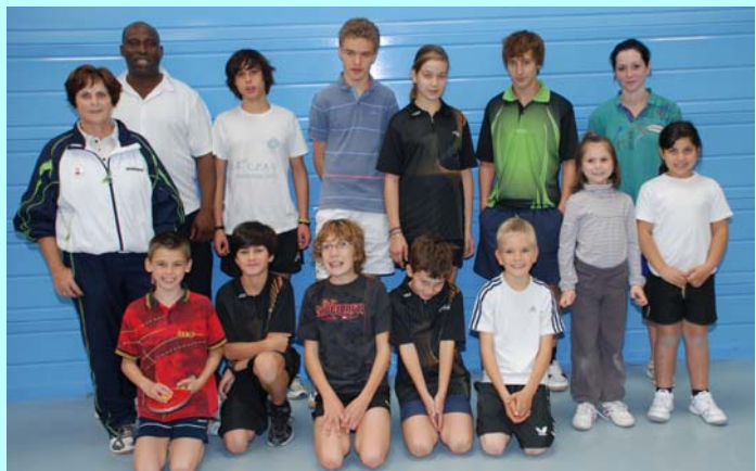
Photo : le groupe des 26 et 27 octobre.